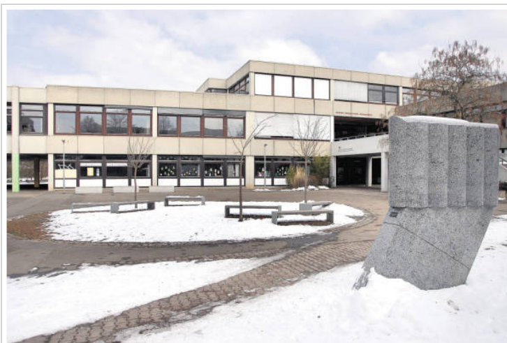
Viele Nutzungsbedürfnisse, zu wenig Platz und Geld: Der Anbau am Murkenbach ist gestorben

Gemeinderat beschließt abgespeckte Erweiterung am Murkenbach-Schulzentrum - OB übernimmt Verantwortung für missglückte Planung