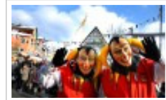
Rosenmontag in Böblingen