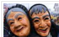
Narren-Umzug in Deckenpfronn